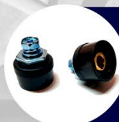
PLUG HEMBRA 35 - 50