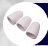
COPA DE PROTECCIÓN