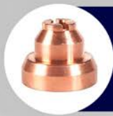
ESCUDOS DE ARRASTRE