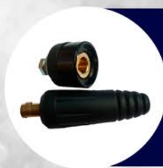
PLUG MACHO 10 - 25