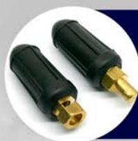
CONECTORES PARA CABLES