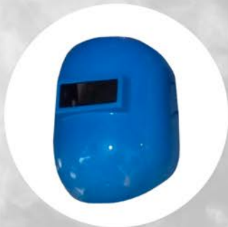
CARETA FOTOSENSIBLE STELCO