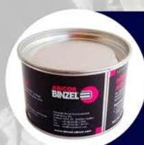
GEL ANTI SPATTER