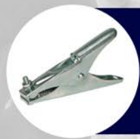
PINZA MASA 300 - 500 AMP