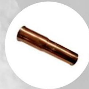
HD24 - 62