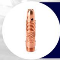
COLLET PRENSA Y BODY