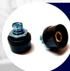
PLUG HEMBRA 10 - 25