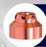
ESCUDOS DE ARRASTRE MECANIZADOS