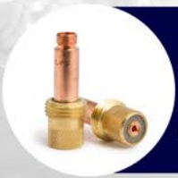
FILTRO GASLENS MEDIANO Y YUMBO