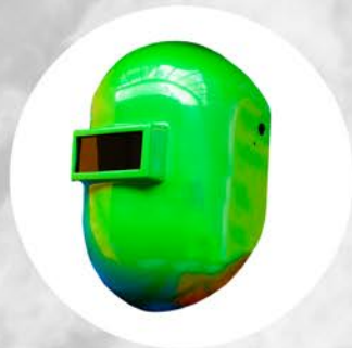
CARETA DE SOLDAR TIPO HUEVO