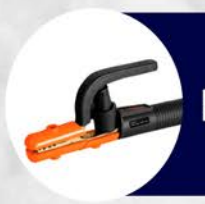
PINZA PORTAELECTRODO 300 - 500 AMP