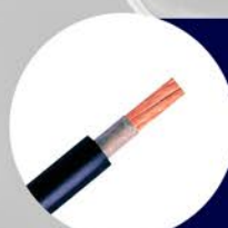
CABLE SOLDADOR #4 #2 #1/0