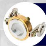
GUÍA DE CORTE