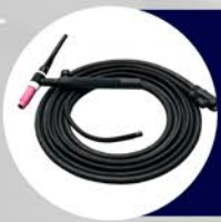
ANTORCHAS 150 - 350 AMP