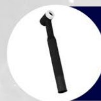
SIN VALVULA FLEXIBLE