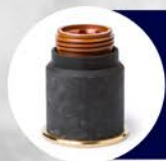
CAPUCHON DE RETENCIÓN