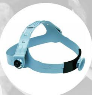
CABEZAL JACKSON NEGRO