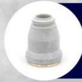
COPA DE PROTECCIÓN PT