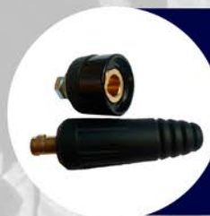
PLUG MACHO 35 - 50