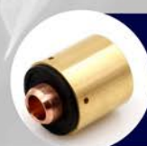
CARTUCHO DE INICIO