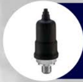
CAPUCHON DE SENSADO