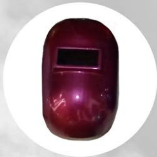
CARETA DE SOLDAR TERMOPLÁSTICO